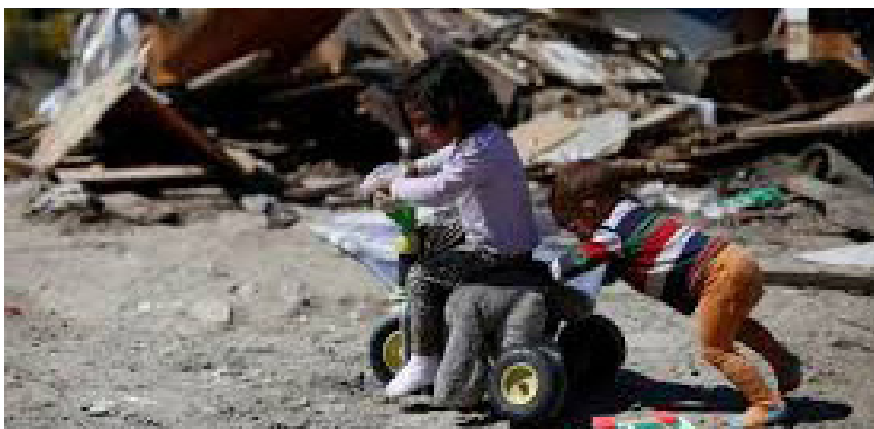
Nens i nenes que viuen en la pobresa