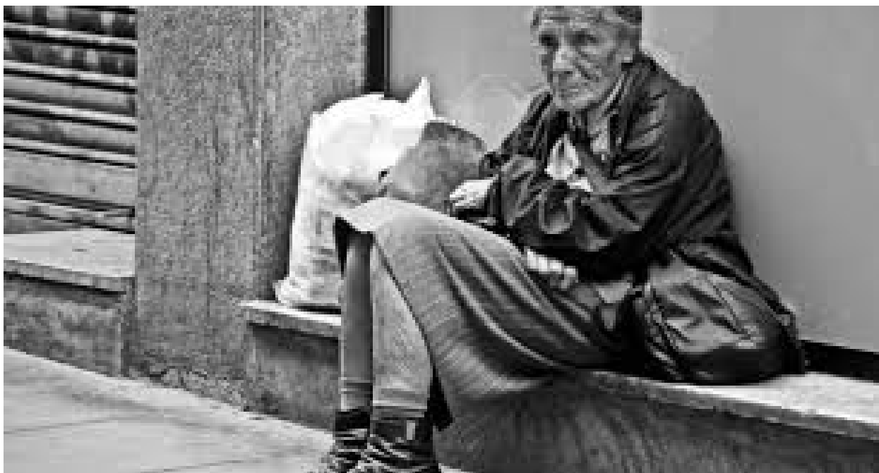
Persones sense llar

Es mostren les següents imatges de persones que en la nostra societat necessiten de l'ajuda dels altres.